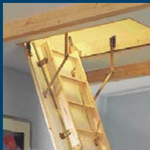
Půdní skládací schody