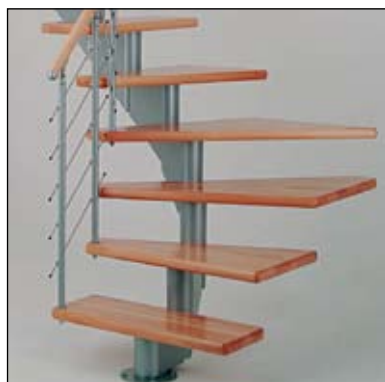
zatočení o \frac{1}{4} s nášlapy v buku