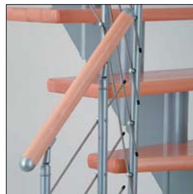
zábradlí s kovovými sloupky, dřevěným madlem a nerezovými pruty – výplně zábradlí

Příklady různých rozložení pro Hamburg s 12 nášlapů (13 výstupy)