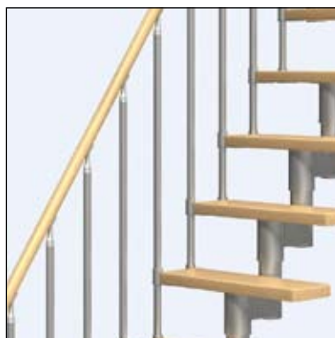
zábradlí s kovovými sloupky a s dřevěným madlem